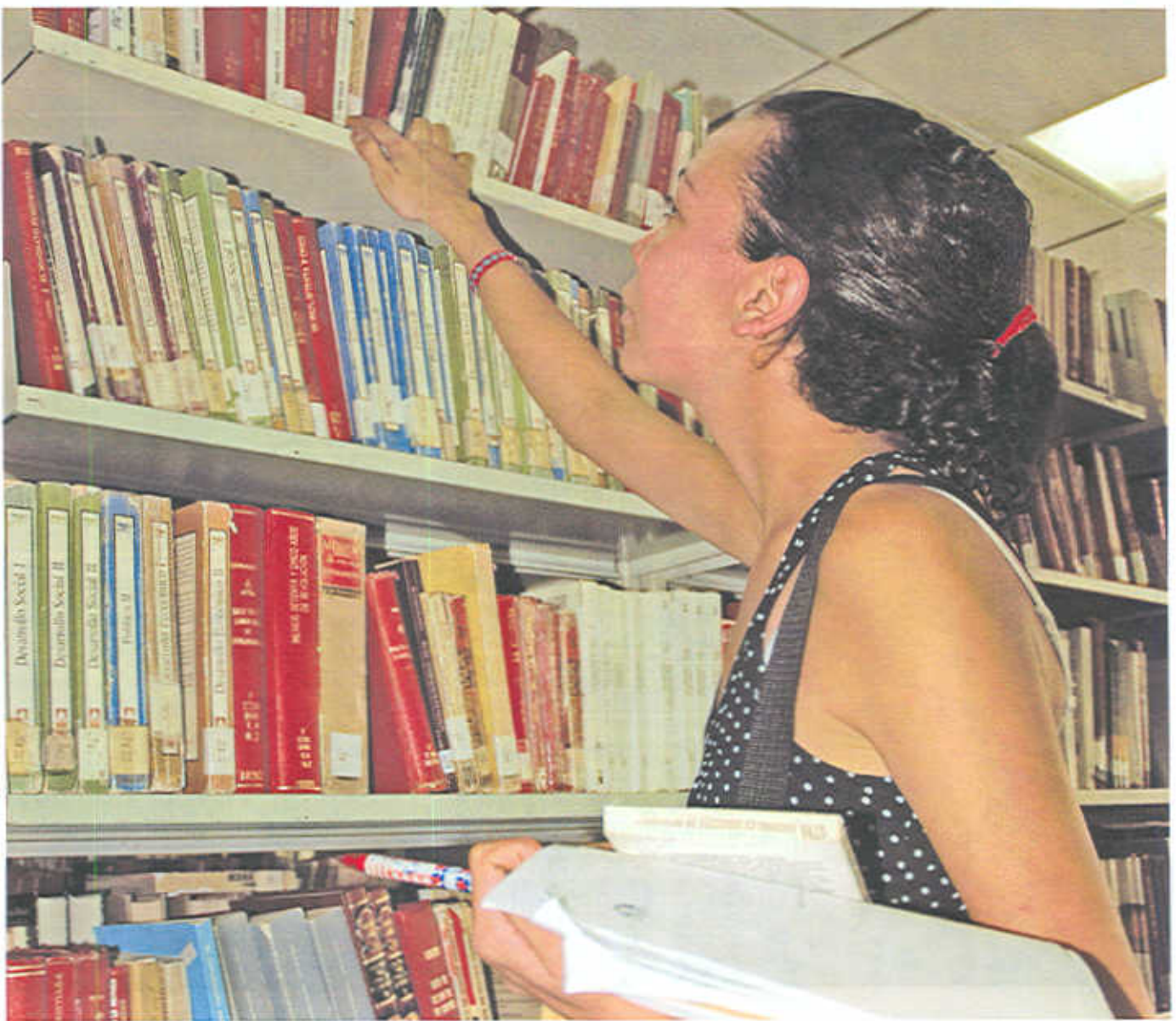
Eje estratégico: Aplicación de las tecnologías de información y comunicación a las actividades académicas y la adecuación de la administración